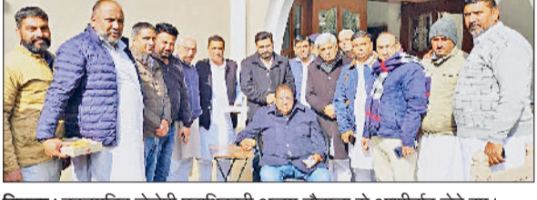
सिरसा। नवचयनित जेजेपी पदाधिकारी अजय चौटाला से आशीर्वाद लेते हुए।

जननायक जनता पार्टी के विभिन्न प्रकोष्ठों के चुने गए हलका प्रधानों ने रविवार को पार्टी के राष्ट्रीय अध्यक्ष डॉ. अजय सिंह चौटाला से मुलाकात की और उनका आभार जताया। अजय चौटाला ने सभी चयनित नवीन पदाधिकारियों को अपनी ओर से शुभकामनाएं देते हुए उन्हें पार्टी संगठन के विस्तार एवं मजबूती के लिए प्रेरित किया। चौटाला ने कहा कि जेजेपी चौधरी देवीलाल की कल्याणकारी सिद्धांतों व नीतियों पर आधारित राजनीतिक