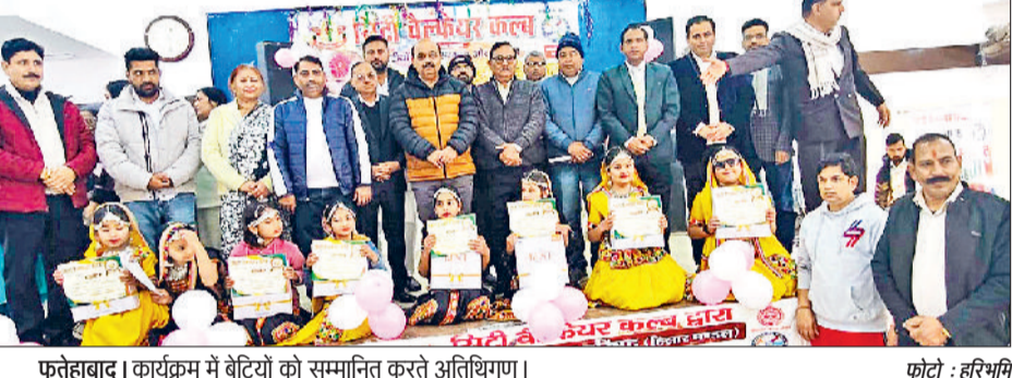
फतेहाबाद। कार्यक्रम में बेटियों को सम्मानित करते अतिथिगण।

लोहड़ी बेटियों के नाम कार्यक्रम हुआ सम्पन्न हरिभूमि न्यूज। फतेहाबाद