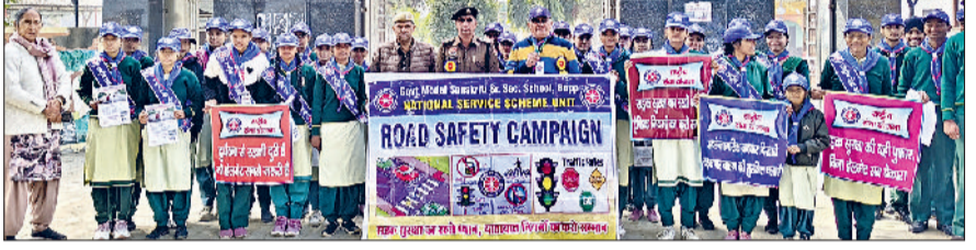
विद्यार्थियों को दी सड़क सुरक्षा संबंधी जानकारी