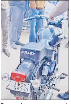
सिरसा। बुलेट बाइक का चालान करते हुए यातायात पुलिस।

रिप्लेक्टर टेप व जागरूकता अभियान से बढ़ाई सड़क सुरक्षा