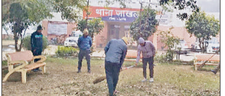
फतेहाबाद। थानों में सफाई अभियान चलाते पुलिस कर्मचारी।