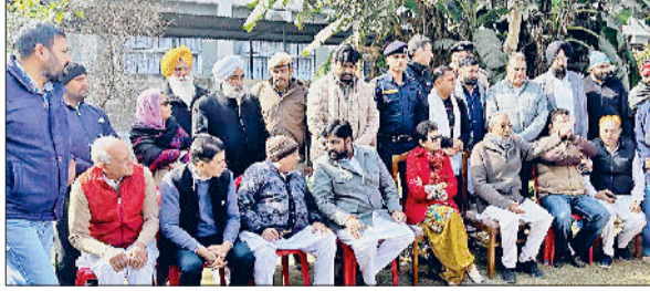
डबवाली। कांग्रेस कार्यकर्ताओं से मुलाकात करते हुए सांसद सैलजा।