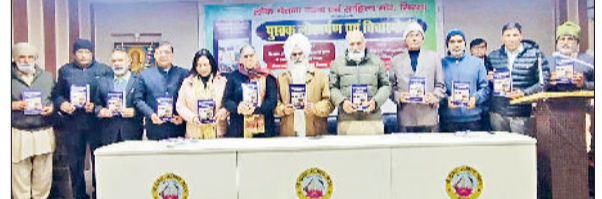
सिरसा। गौरव गाथा पुस्तक का लोकार्पण करते हुए अतिथि।