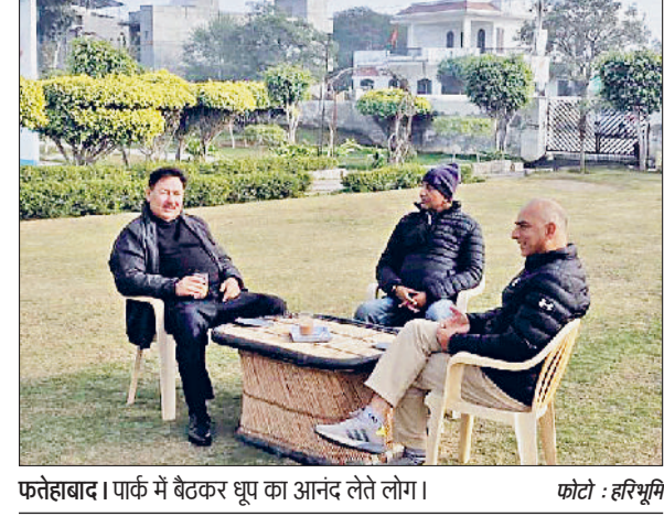
फतेहाबाद। पार्क में बैकवर धूप का आनंद लेते लोग।