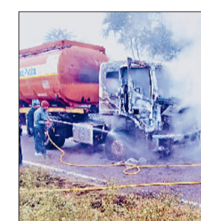
फतेहाबाद। कंटेनर में लगी आग को बुझाते दमकाल कर्मचारी।

नेशनल हाइवे 9 हिसार रोड पर गांव धांगड के समीप खड़े ऑयल कंटेनर के कैबिन में रविवार को शार्ट सर्किट के चलते अचानक आग लग गई। कैबिन में आग देखकर चालक ने सूझबूझ का परिचय दिया और तुरंत कंटेनर को सड़क किनारे खड़ा कर पुलिस और फायर ब्रिगेड की सूचना दी। सूचना मिलते ही पुलिस टीम और फायर ब्रिगेड की गाड़ी मौके पर पहुंची और आग पर काबू पाया गया। यदि आग कैबिन से आगे फैलती, तो ऑयल कंटेनर होने के कारण गंभीर हादसा हो सकता था। मिली जानकारी