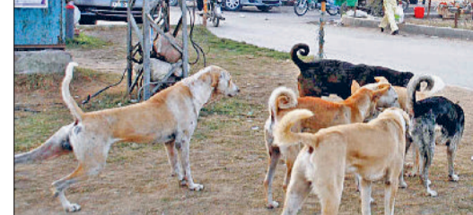
फतेहाबाद। शहर में घूमते आवारा कुत्ते, नागरिक अस्पताल फतेहाबाद तथा कुत्तों के काटने से बना घाव।

कुत्तों के हमले का शिकार बने लोग मुआवजे से वंचित हरिभूमि न्यूज। फतेहाबाद